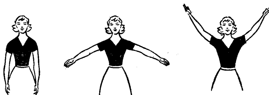
Рис. 4 Подготовительное