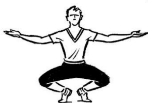
Рис. 81 Глубокое приседание