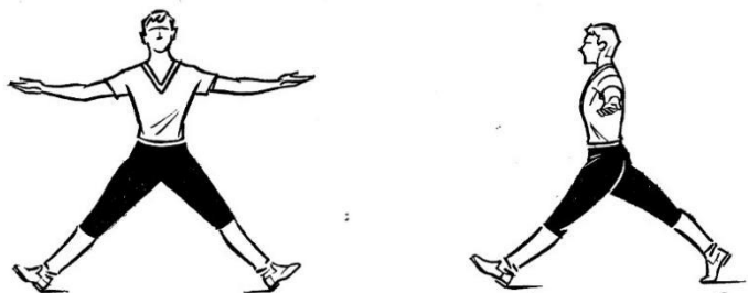
Рис. 13 «Полуприсядка вперед – назад» Рис. 14 «Полуприсядка «разножка» в стороны»