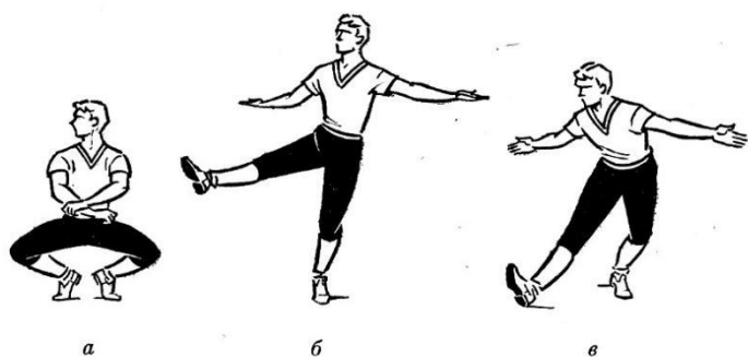
Рис. 82 Полуприсядка с открыванием ноги на ребро каблука